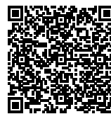
GUNAWAN SALIM Asesor Kompetensi